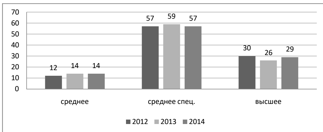
Рисунок Б.2 – Состав персонала по уровню образования