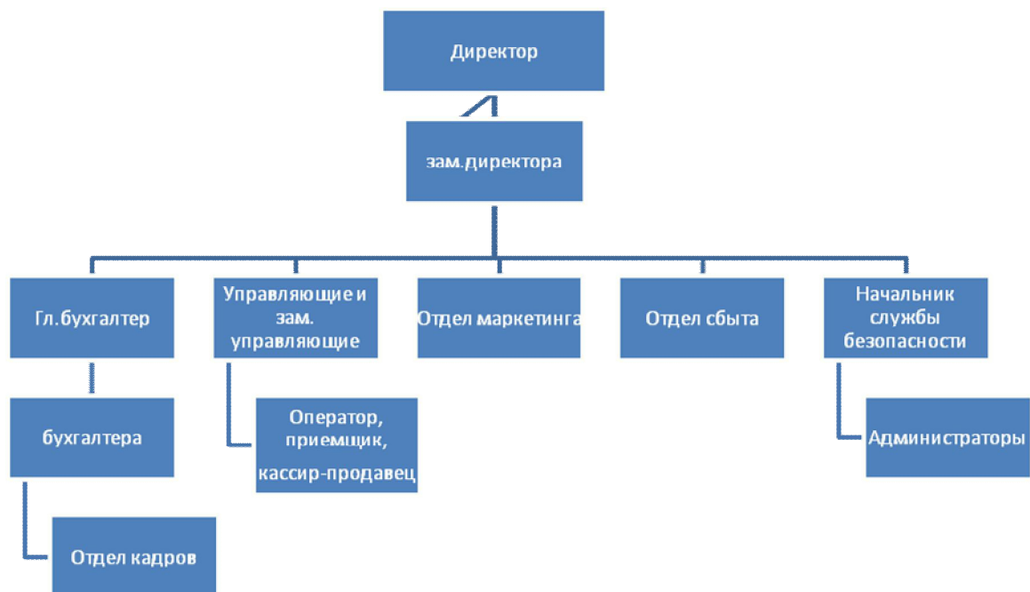
Рисунок 2.1- Схема линейной структуры данного предприятия

Организационная структура данного предприятия линейная (рисунок 2.1). Она имеет ряд достоинств: четкие системы взаимосвязи между руководителями и подчиненными, быстрота реакции в ответ на прямые указания, личная ответственность руководителя за конечные результаты предприятия и другие. Есть и недостатки, такие как высокие требования к руководителю и перегрузка менеджеров.