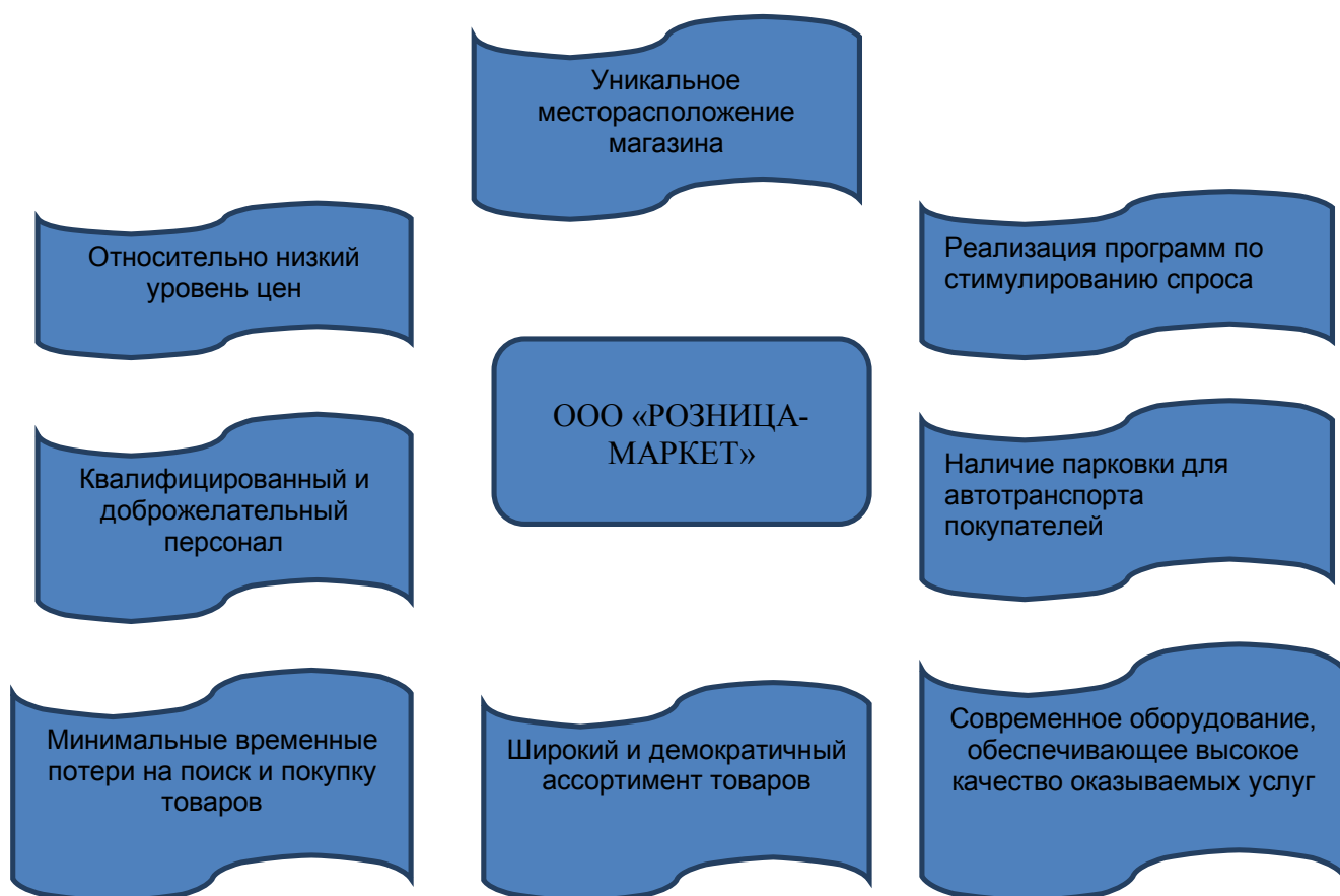
Рисунок 2.2 – Схема конкурентных преимуществ магазина

Для того чтобы ограничить количество приоритетных конкурентов, необходимо выделить ключевые факторы, которые играют важную роль для ООО «Розница-маркет» и такие факторы имеются и хорошо влияют на её дальнейшее развитие (рисунок 2.2).